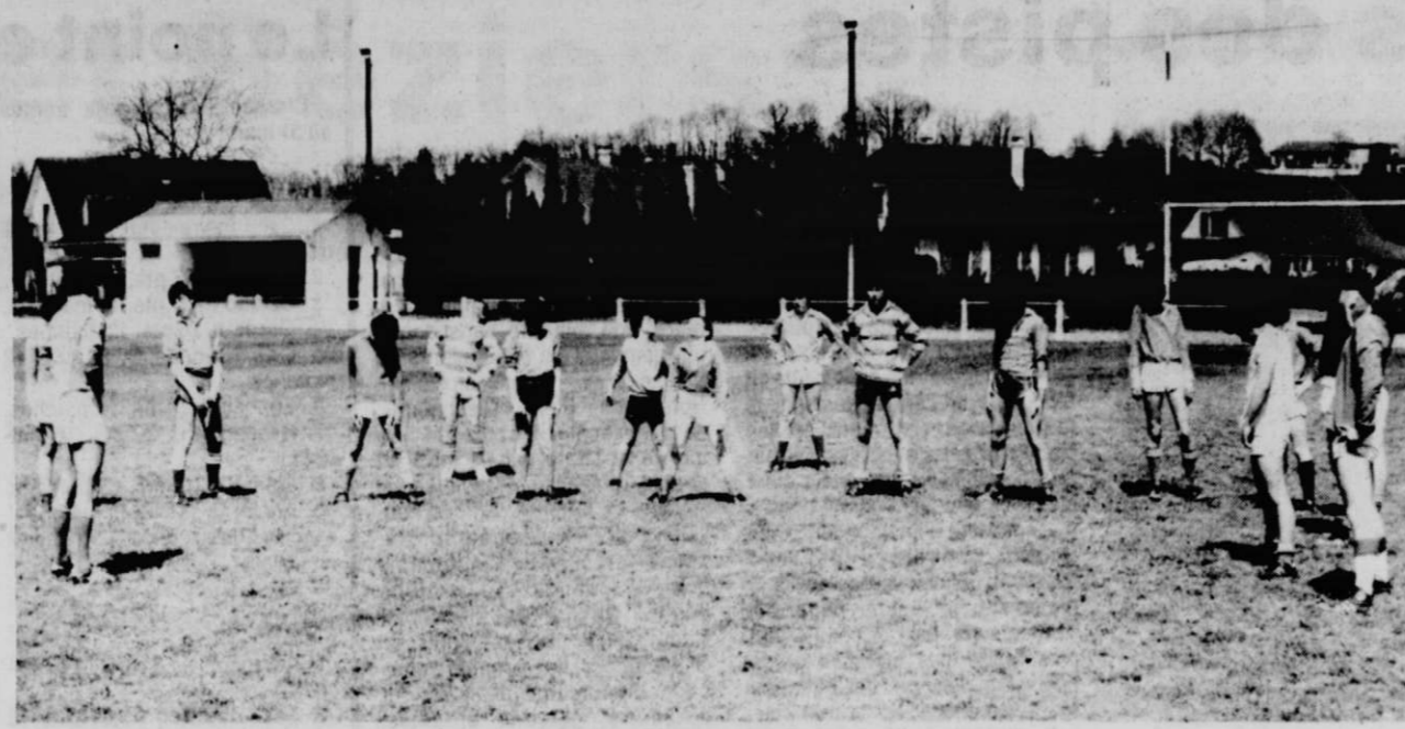
Séance de préparation physique chez les jeunes de l'école de rugby.

Samedi seule l'école de rugby s'entraîne. Une vingtaine de jeunes étaient présents sous un beau soleil et avec une pelouse en parfait état. Ils ont préparé le match amical de samedi prochain, contre les PTT. Présence de tous indispensables, y compris ceux qui voudraient commencer la pratique du rugby.