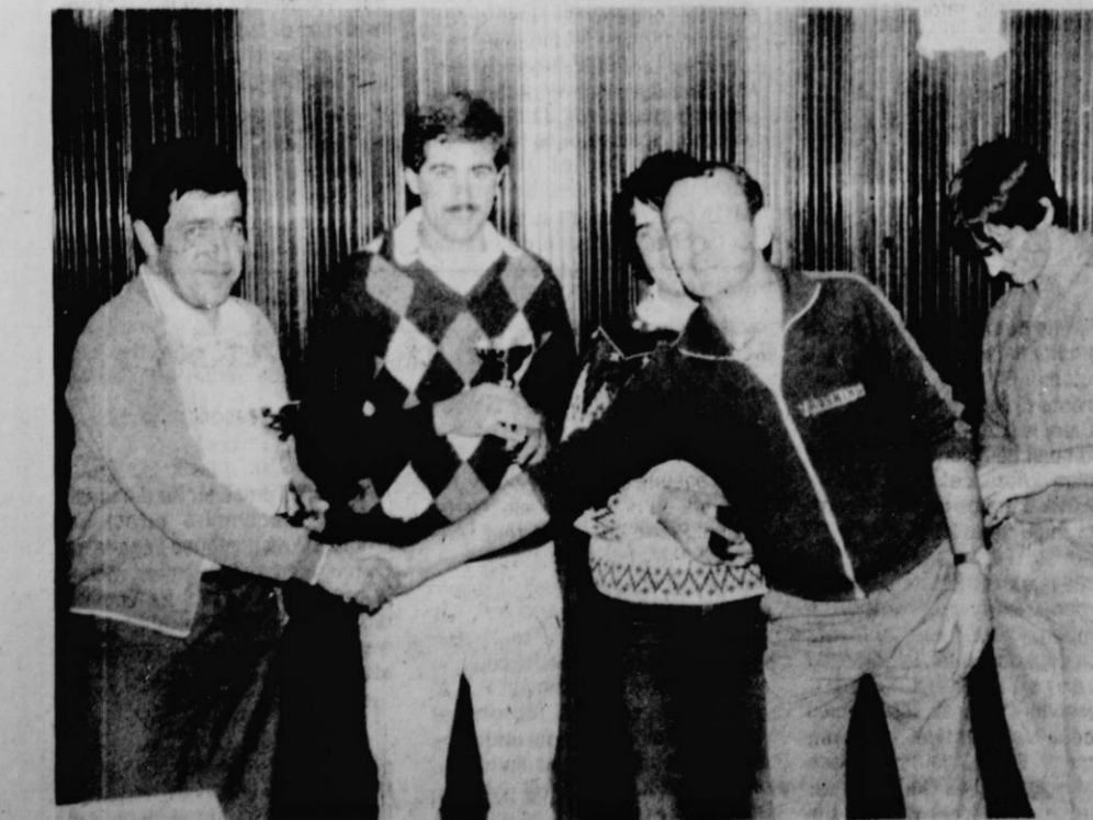
Les vainqueurs récompensés.