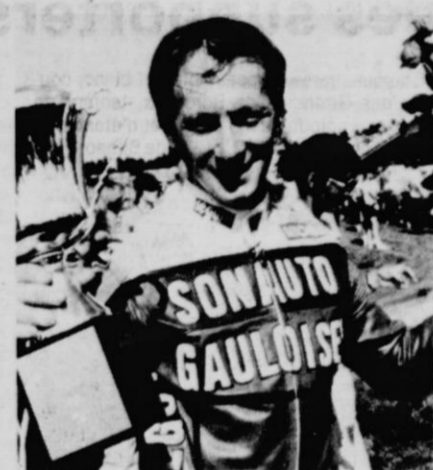
Dimanche, Nogaro fête son champion du monde Christian Sarron.