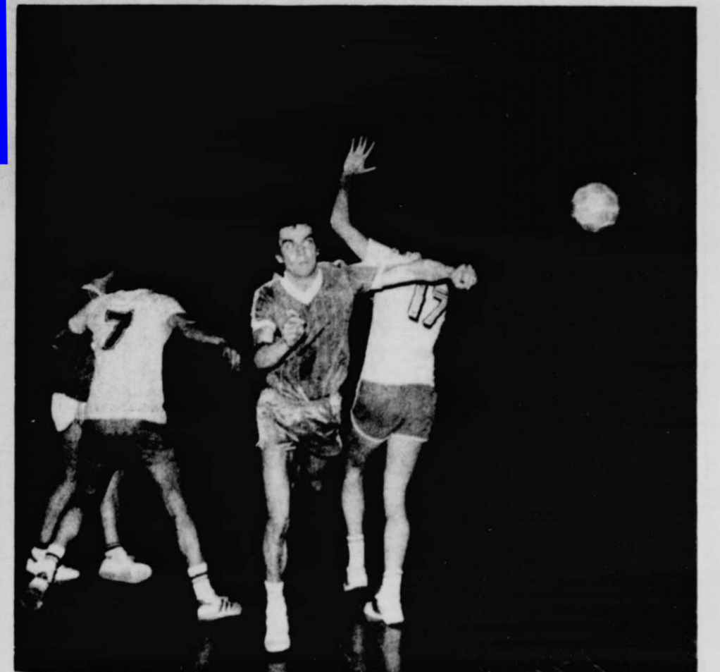
Une phase de cette finale âprement disputée.

Et ce qui devait arriver, arriva. Marqués égale trois buts. Deux fois cinq minutes pour la prolongation. Jurançon n'y croyait plus, Barzun était couronné champion Excellence 1984. Partie bien dirigée par M. F. Nouguez.