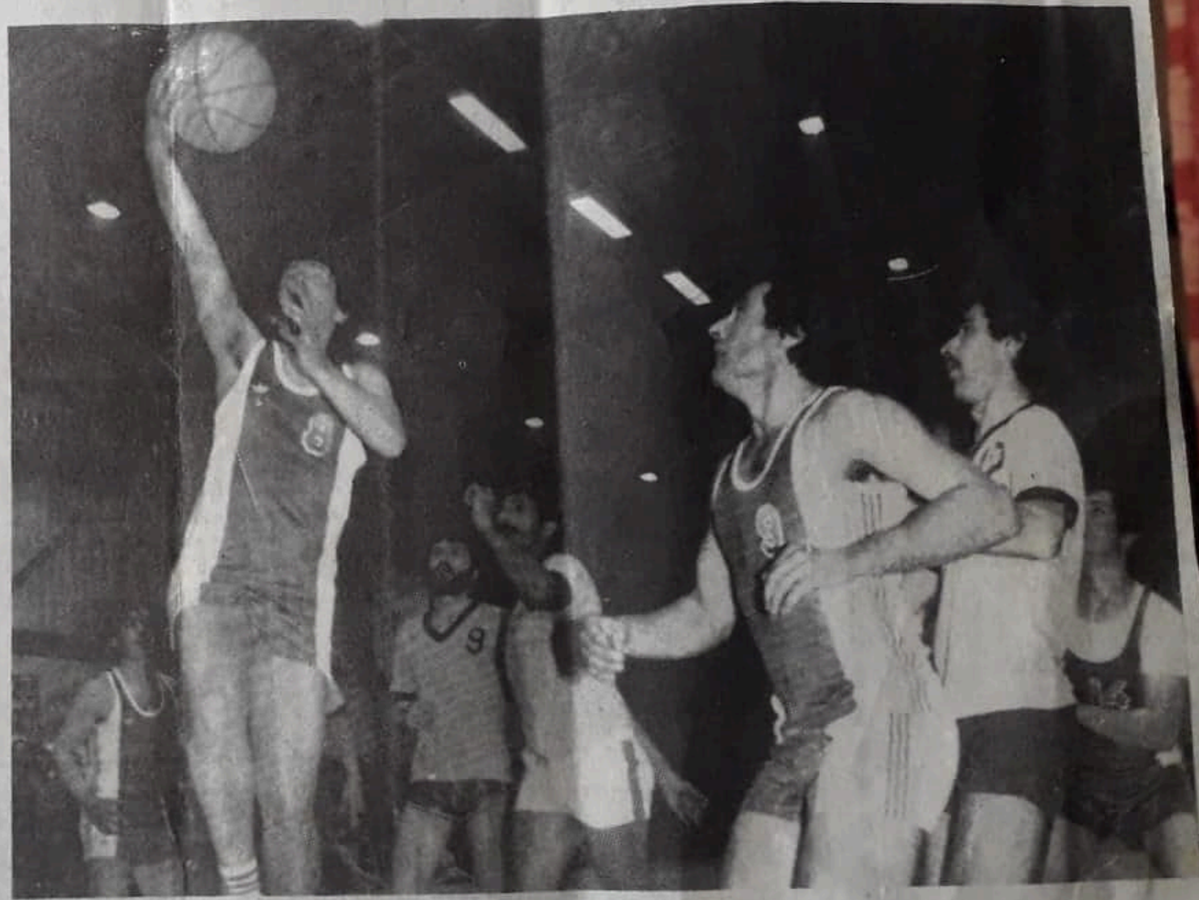
Mialos, champion départemental, opérera la saison prochaine en Honneur Aquitaine. Belle ascension !