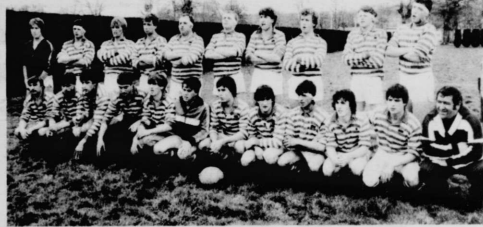
Les juniors de l'entente Gan-Lasseube.

Samedi dernier, ils affrontaient en amical, les juniors B du FCO.